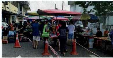
公会负责的早夜市，目前皆有聘用志愿警卫队管控。

据悉，巴生市议会在6月期间，只批准首阶段旗下管理的29个市集开档，主要原因是部分早、夜市由乡村管理委员会、市议会委员会及居民协会等所管辖。