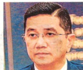
Mohamed Azmin Ali