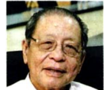
外身为？ 林吉祥：国内的路坑，而意人因着国内的恶棍当道治理而奄奄一息。